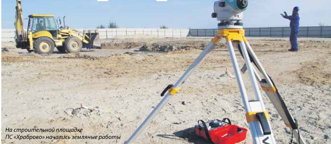
На строительной площадке ПС «Храброво» начались земляные работы