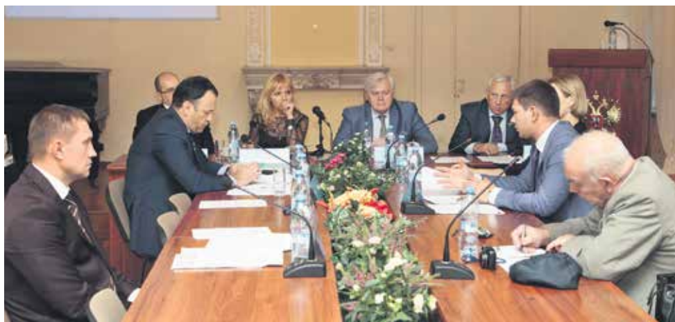
Участники круглого стола в Институте государства и права РАН

В Институте государства и права РАН к 90-летию создания института состоялся круглый стол на тему «Проблемы правового регулирования электросетевого комплекса». Соорганизаторами выступили Университет имени О. Е. Кутафина и ПАО «Россети». Встреча состоялась в рамках соглашения о сотрудничестве ИГП РАН с ПАО «Россети».