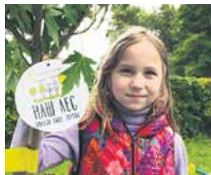
Экологические мероприятия — добрая традиция в «МОЭСК». Многие сотрудники компании приобщают к посадкам своих детей

Б олее 2000 саженцев и семян деревьев разных пород было