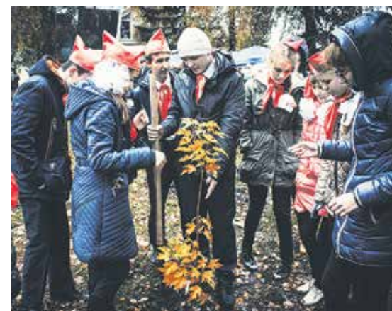
Мероприятие было стилизовано под советский субботник, в котором участвовали и молодежь, и ветераны

более 100 деревьев. Хотя саженцы готовы к капризам сибирской погоды, энергетики будут еженедельно ухаживать за ними, пока они не приживутся. Нынешняя акция была посвящена 70-летию Победы в Великой Отечественной войне. Местом ее проведения выбрали парк, который планируется облагородить и создать там зону отдыха горожан. В конце акции участников ждали полевая кухня и чай.