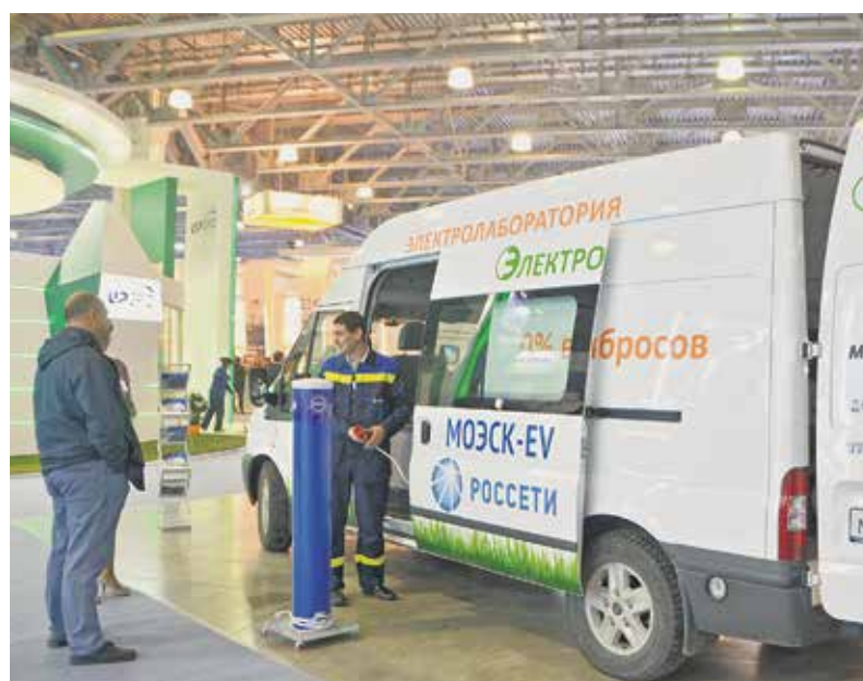
Корпоративный электротранспорт «МОЭСК» — мобильная лаборатория

По официальным данным, на конец 2015 года только в Москве количество ЭЗС составит порядка 270. В Санкт-Петербурге до конца 2016 года планируют установить свыше 25 ЭЗС. Зарядки