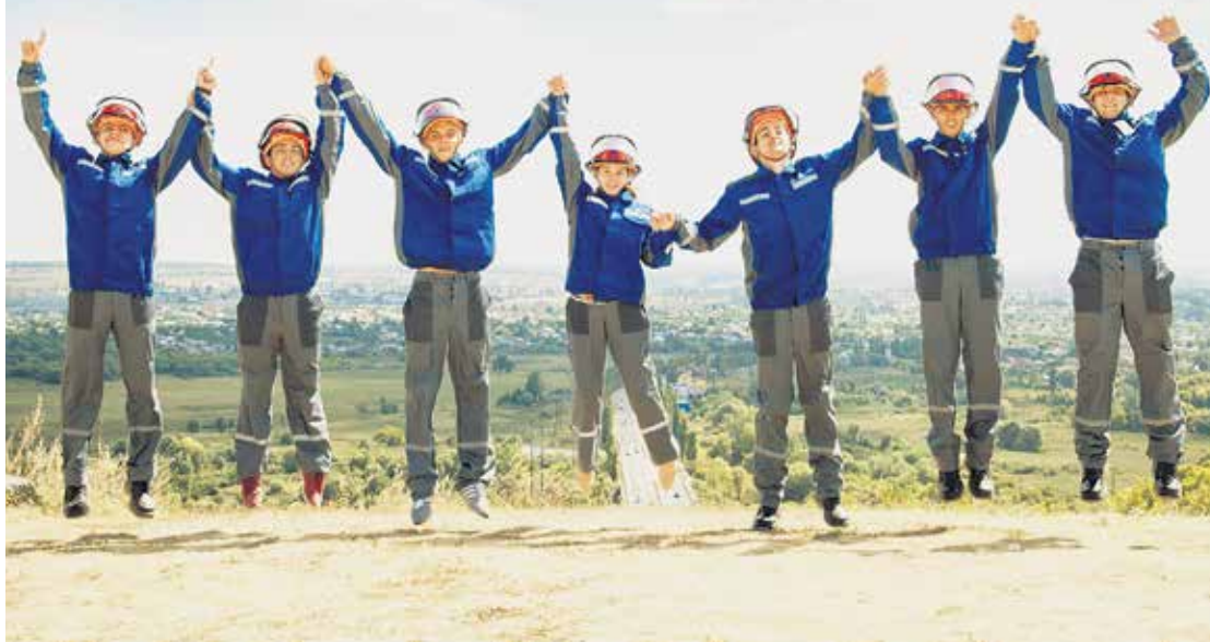
Участники студенческого отряда «Импульс», работавшие на энергообъектах «МРСК Центра» в Белгородской области (2015)

Торжественные мероприятия, посвященные закрытию шестого сезона студенческих строительных отрядов электросетевого комплекса ПАО «Россети» в этом году прошли на базе Национального исследовательского университета «Московский энергетический институт», который в этом году отмечает свое 85-летие.