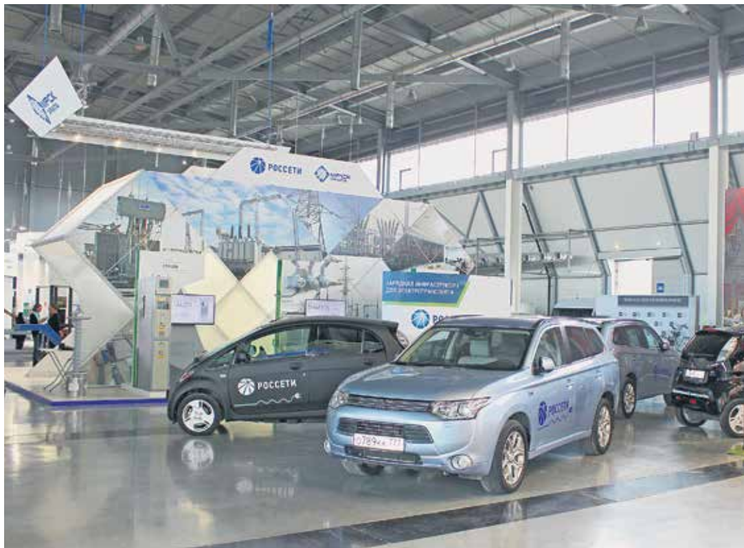
Электромобили Mitsubishi на выставочном стенде «Россетей»