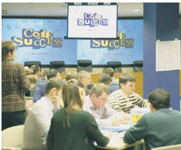
Участники отборочного этапа ММФ-2014

Н а Международный круглый стол молодежной площадки «Россетей» на Rugrids-Electro приглашены представители команды «Россетей», ГЭК Китая, EDF, немецких энергетических компаний и команда молодых ученых-энергетиков России. На встрече совместно с отраслевыми экспертами будет выработана тематика практико-ориентированного проекта для дальнейшей совместной реализации командами. Ожидается, что данный проект, направленный на трансграничную интеграцию энергосистем будущего, станет интернациональным и будет реализован на базе итогов и наработок прошедшего ММФ.