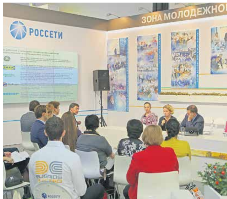
На одном из мероприятий зоны молодежной политики Rugrids-Electro-2014

В этом году на ней пройдут несколько значимых мероприя-