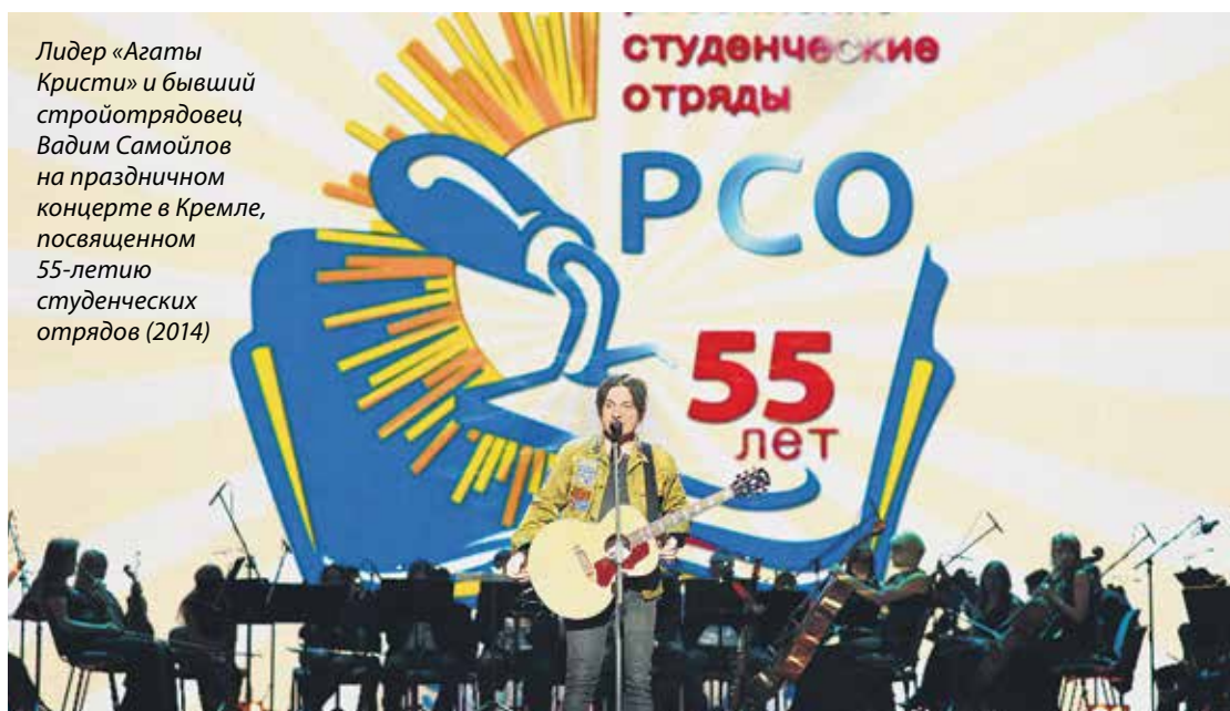
Лидер «Агаты Кристи» и бывший стройотрядовец Вадим Самойлов на праздничном концерте в Кремле, посвященном 55-летию студенческих отрядов (2014)

По завершении официальной части состоялся праздничный концерт творческих коллективов студенческих отрядов, фуршет и дискотека. Всем присутствующим был предложен праздничный торт. 🌟