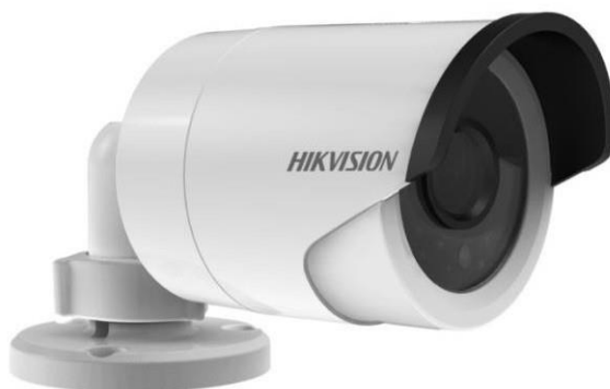
Рис. 6.1 - IP-камера корпусная уличная DS-2CD2022-I (4.0)

IP-камера корпусная уличная DS-2CD2022-I (4.0)