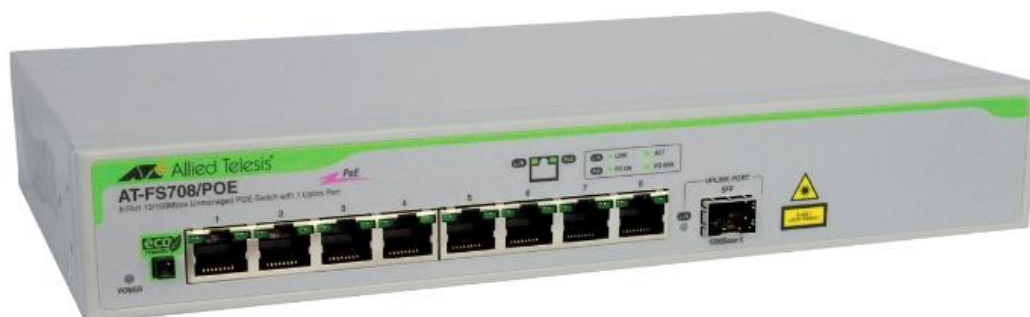
Рис. 6.2 - Неуправляемый коммутатор Allied Telesis AT-FS708/POE