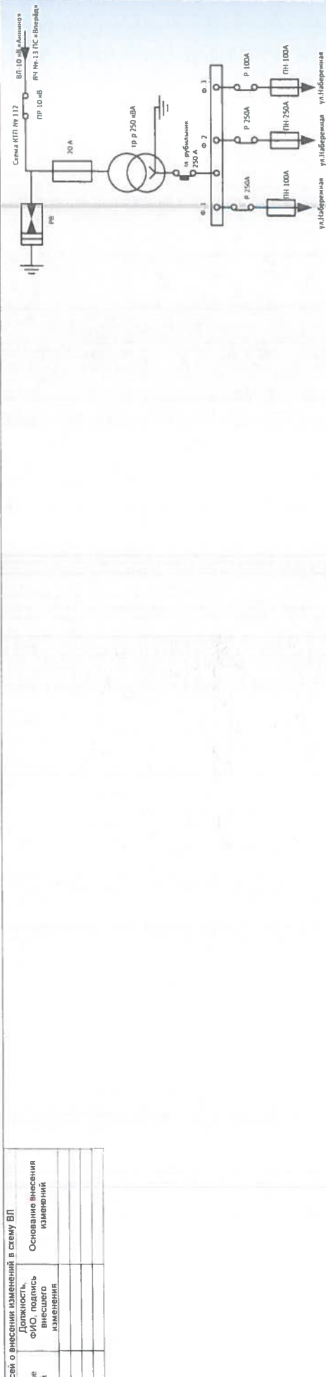
Таблица записей о внесении изменений в схему ВЛ