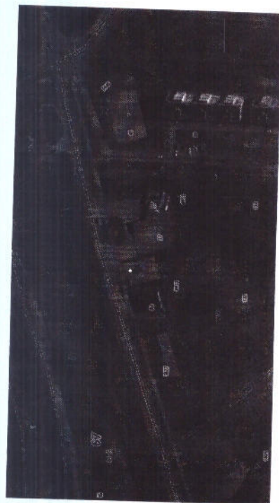
Схема расположения участка М 1:2000