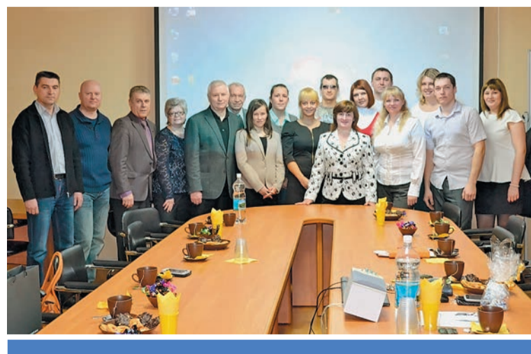
Молодые специалисты Тверьэнерго на семинаре профсоюзных организаций региона