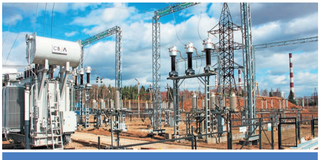
Модернизация подстанции проходит без отключения потребителей. Окончание работ запланировано на четвертый квартал 2014 года

На финансирование второго этапа работ в инвестиционную программу Костромаэнерго на 2014 год заложено 24 млн рублей.