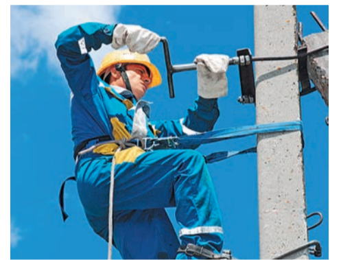
По итогам первого квартала план по ремонту воздушных линий 0,4–10 кВ выполнен на 118%