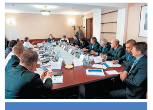
По итогам совещания главным инженерам филиалов были даны поручения по разработке параметров долгосрочных целевых программ, касающихся их направлений деятельности