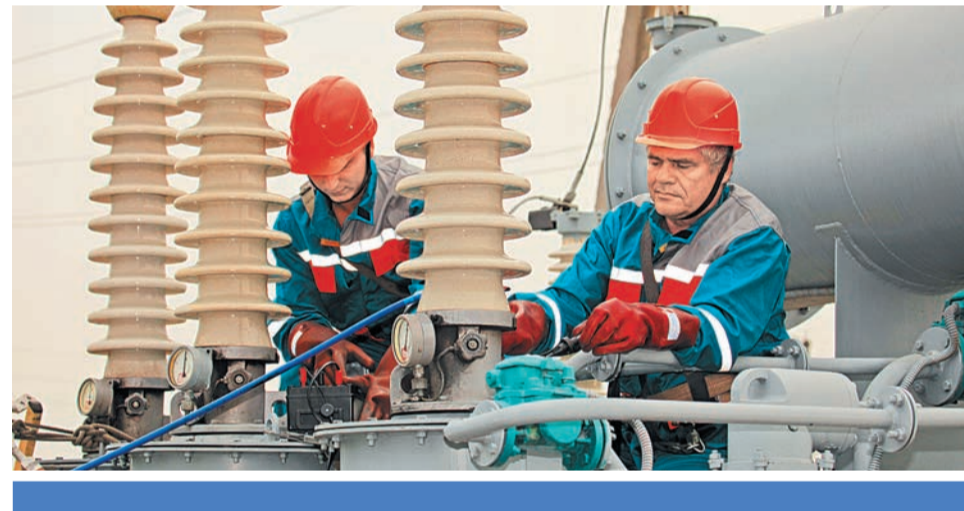
В течение 2014 года планируется отремонтировать более 160 подстанций