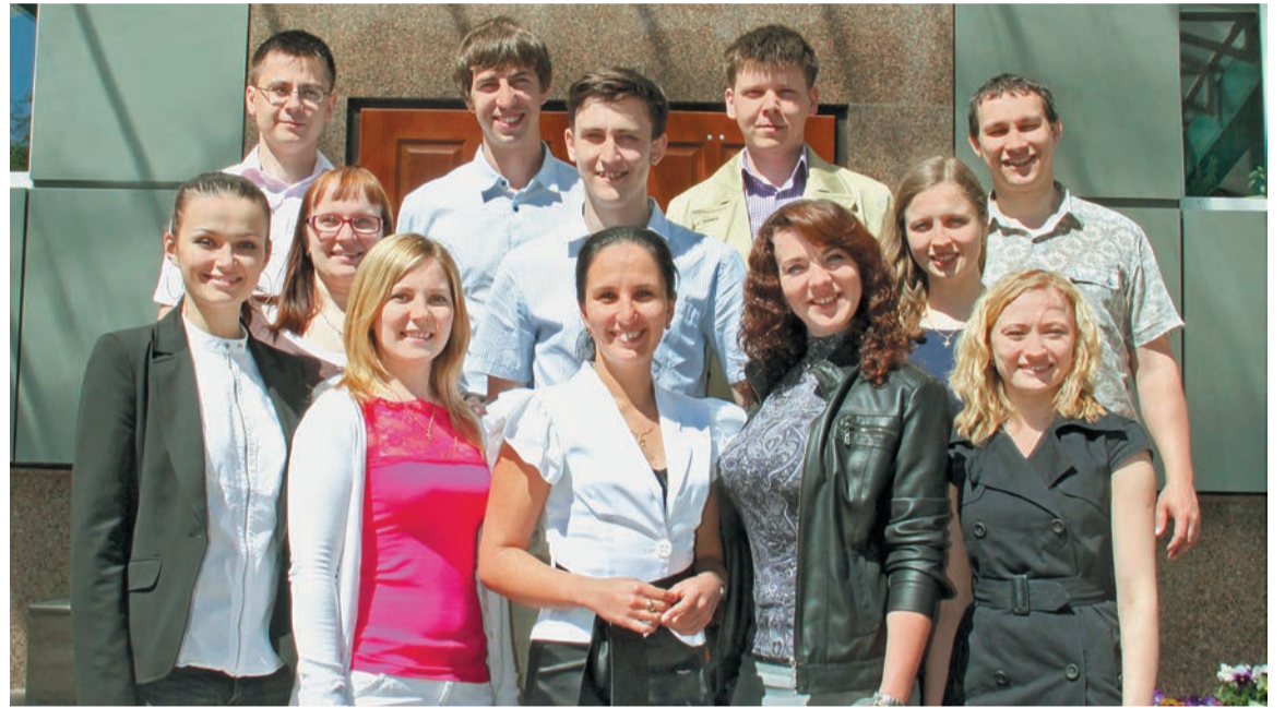
Члены молодежного совета Ярэнерго

Своя традиция у молодежного совета Брянскэнерго: молодые энергетики филиала являются организаторами благотворительных акций по сдаче крови «Стань донором!». Только в ходе акции, прошедшей в Брянскэнерго весной нынешнего года, работники филиала сдали 20 литров крови.