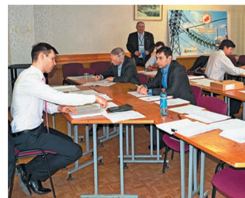
Участники соревнований на этапе противоаварийной тренировки