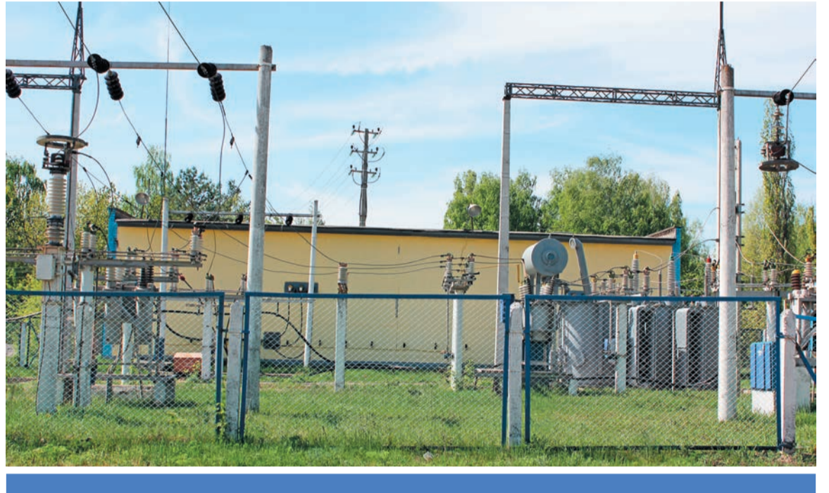
Воронежэнерго, подстанция 110 кВ «ВПИ»

В ряде филиалов МРСК Центра, благодаря реализации компанией оптимизационных мероприятий, удалось сохранить объемы инвестпрограммы на уровне, близком к предыдущим годам. Так, Липецкэнерго направит в нынешнем году на реализацию инвестиционной программы 1,78 млрд рублей, что соответствует