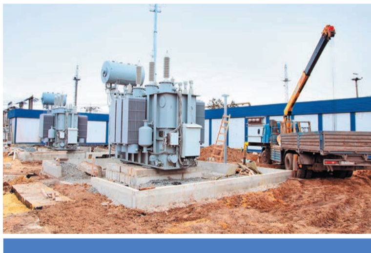
Белгородэнерго: строительство подстанции 110 кВ «Крейда»