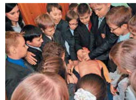
В ходе занятий школьники получали как теоретические знания, так и практические навыки