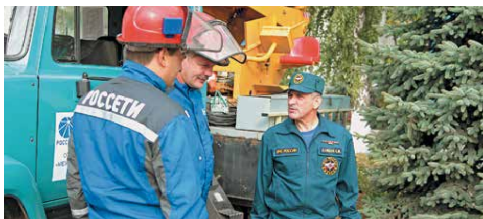
Филиалы МРСК Центра тесно взаимодействуют с МЧС и региональными оперативными службами в вопросах предотвращения и ликвидации чрезвычайных ситуаций

в смотре. Всего на 0,04% отстал от лидеров липецкий филиал МРСК Центра. Третье место с результатом 95,11% заняло Курскэнерго. В целом по МРСК Центра показатель выполнения установленных критериев в сфере пожарной безопасности в 2014 году составил 94,33%, что на 2,6% выше уровня прошлого года.