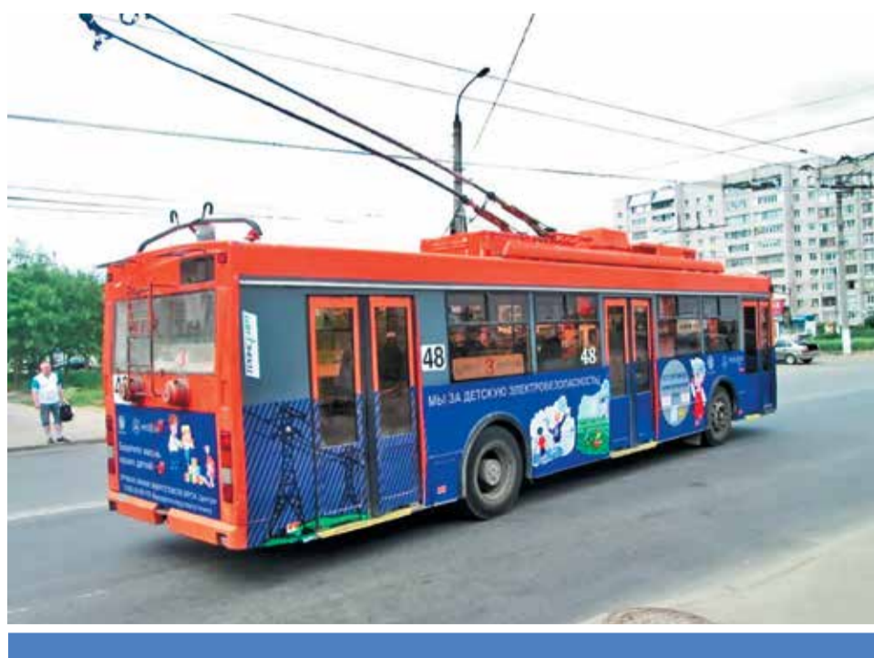
В Твери городской транспорт стал наглядным пособием по электробезопасности