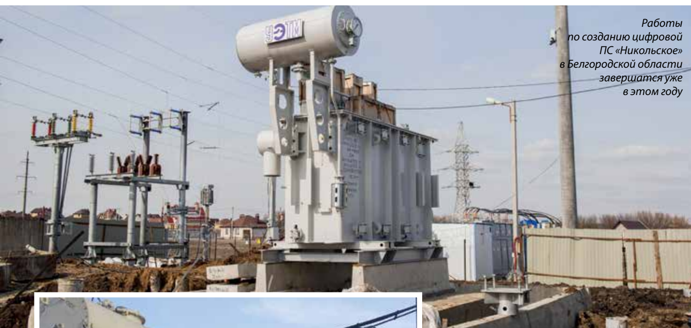
Работы по созданию цифровой ПС «Никольское» в Белгородской области завершатся уже в этом году