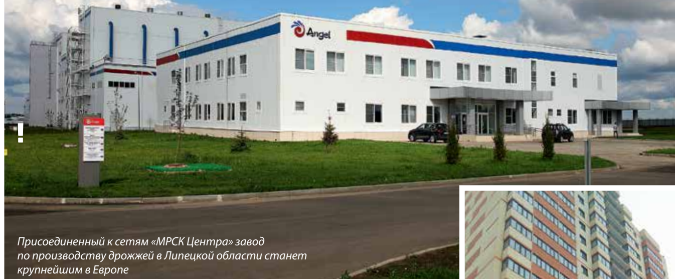
Присоединенный к сетям «МРСК Центра» завод по производству дрожжей в Липецкой области станет крупнейшим в Европе