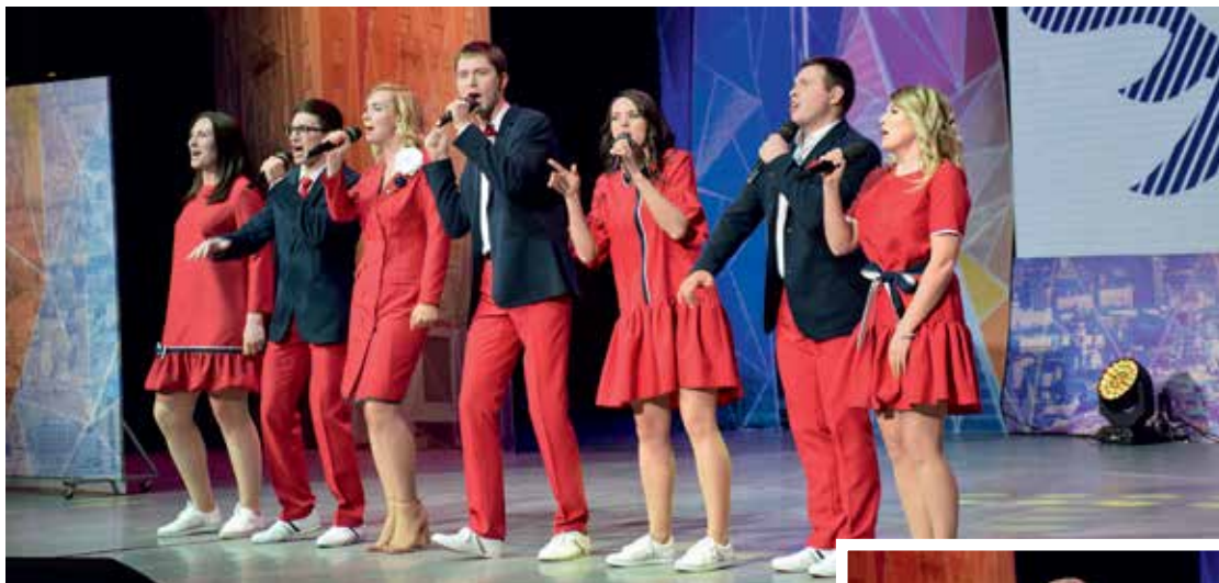
Выступает команда филиала «МРСК Центра и Приволжья» — «Кировэнерго»

Ф естиваль, организованный телевизионным творческим объединением «АМИК», прошел в Москве в ММЦ «Планета КВН». Участие в нем приняли команды веселых и находчивых сотрудников компаний — крупных представителей бизнес-сообщества: ПАО «Лукойл», ПАО «Сибур холдинг», ФГПУ «Почта России», ПАО «РЖД», Procter & Gamble и других. «МРСК Центра» и «МРСК Центра и Приволжья» представляли команды филиалов «Ярэнерго» и «Кировэнерго» соответственно.