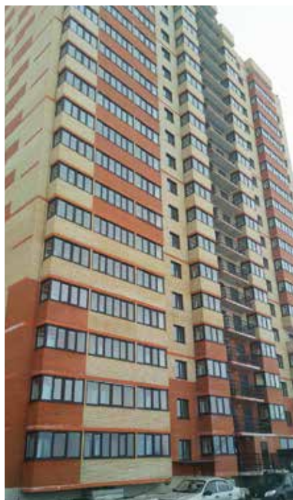
ЖК «Шереметьевский квартал», строящийся в Рязанской области в рамках госпрограммы «Жилище», предоставят 7 МВт

Значительные объемы работ были выполнены специалистами «МРСК Центра» и «МРСК Центра и Приволжья» в январе-марте и в части технологического присоединения жилья и сопутствующей инфраструктуры. Один из значимых проектов в этой области был реализован энергетиками филиала «МРСК Центра и Приволжья» — «Мариэнерго», которые провели работы по ТП новой трансформаторной подстанции, предназначенной для электроснабжения нового жилого комплекса «Ясная Поляна», строящегося в пригороде Йошкар-Олы, в поселке городского типа Медведево. Первый дом ЖК «Ясная Поляна» будет сдан летом 2019 года. Помимо жилья в перспективе здесь планируется построить две школы, три спортивных стадиона, шесть детских садов, поликлинику и два торговых центра.