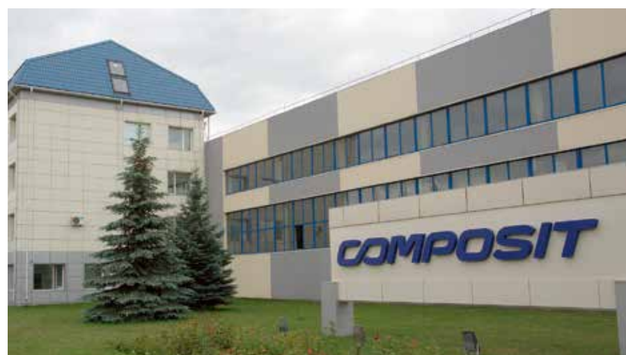
Необходимые объемы мощности от курского филиала «МРСК Центра» получит НПО «Композит»