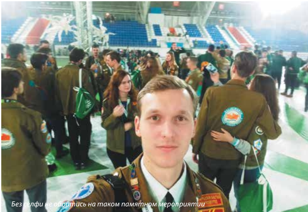
Без галфи не обойтись на таком памятном мероприятии

Более 2000 бойцов из 64 регионов страны собрал 57-й Всероссийский слет студенческих отрядов, прошедший в Новосибирске с 11 по 13 ноября. Электросетевой комплекс делегировал лучший стройотряд сезона 2016 года «Резонанс», представляющий Калининградский государственный технический университет и АО «Янтарьэнерго».