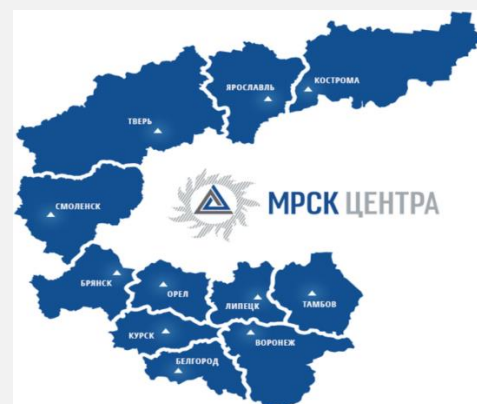
Территория обслуживания - 457 700 км 2