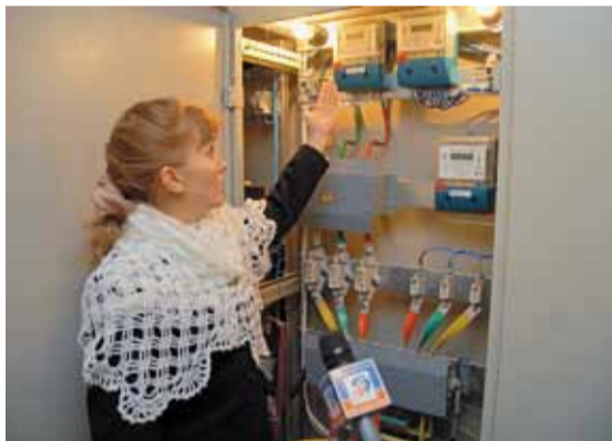
Вводное устройство с интеллектуальными счётчиками «Нейрон»