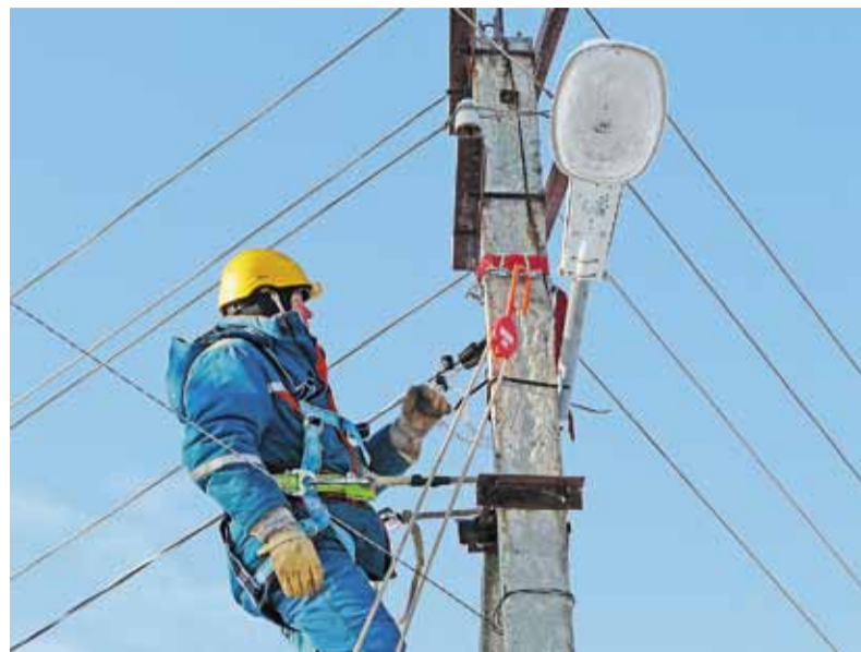
Единый сетевой комплекс — единая техническая политика

Установление контроля над второй по величине электросетевой компанией Ярославской области — значительный шаг в реализации политики интеграции электросетевого комплекса, проводимой ОАО «МРСК Центра», а участие в управлении ОАО «ЯрЭСК» представителей администрации Ярославской области открывает широкие