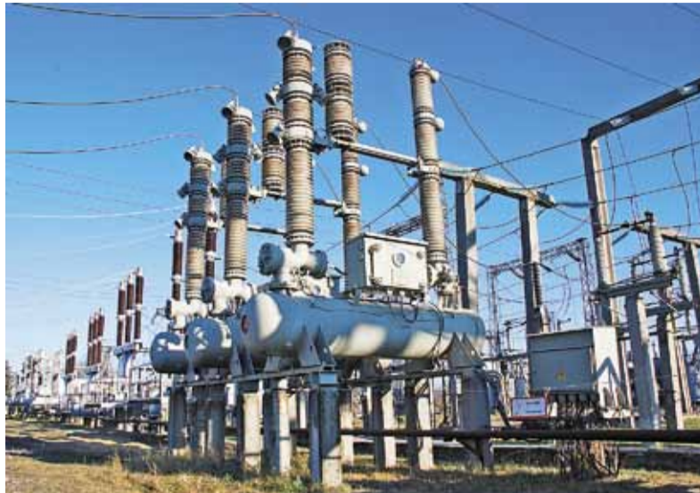
В 2010 году большинству филиалов ОАО «МРСК Центра» предстоит переход к регулированию тарифов на основе методологии RAB. Решение об этом принято Советом директоров компании 16 октября 2009 года.

Ещё одним критерием ответственности тарифа можно назвать стимул экономии средств на операционные расходы компании. Их основу составляют затраты на сырьё и материалы, ремонт основного оборудования, оплату труда сотрудников и отчисления на социальные нужды. Экономия от сокращения операционных издержек не исключается регулирующими органами из тарифа следующих периодов, как сейчас, и может быть использована компанией на развитие сетевого