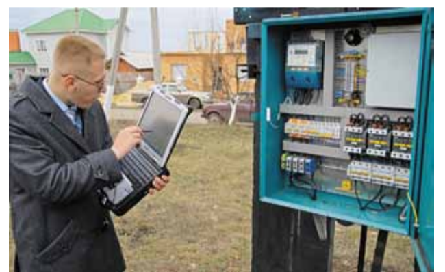
Демонстрация работы автоматизированной системы управления уличным освещением «Гелиос»