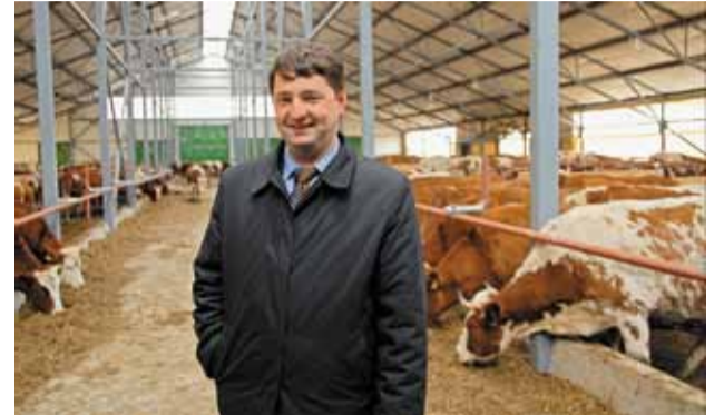
Молочная экоферма «Толоконное-2», Белгородский район