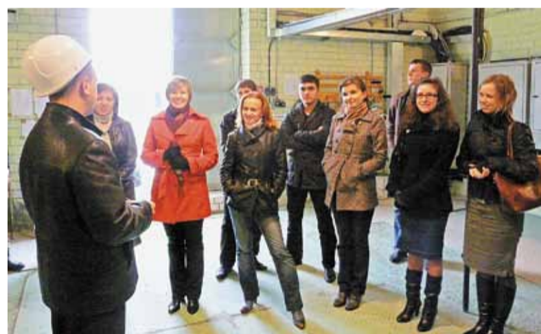
Понять теорию на практике гораздо проще

Далее экскурсия переместилась в Центр управления сетями (ЦУС), откуда осуществляется оперативное управление электросетевым комплексом Ярославской области. И снова увидели... подстанцию «Северная». Только теперь в схематичном изображении, выведенном на огромную видеостену, состоящую из восьми видеокубов. Современное техническое оборудование ЦУСа позволяет диспетчерам в режиме реального времени контролировать работу и техническое состояние входящих в Ярославскую энергосистему под-