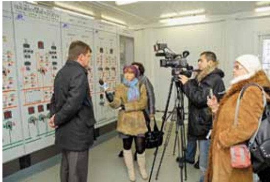
На оперативном пункте управления ПС-110 кВ «Майская»

В филиале ОАО «МРСК Центра» — «Белгородэнерго» состоялся пресс-тур для представителей региональных СМИ, в ходе которого журналисты познакомились с первыми итогами применения в Белгородской области новой системы тарифорегулирования, внедрённой с 1 января 2009 года. Корреспонденты побывали на объектах энергетики, построенных благодаря методике регулирования тарифа на услуги по передаче электрической энергии с применением метода доходности инвестированного капитала (RAB).