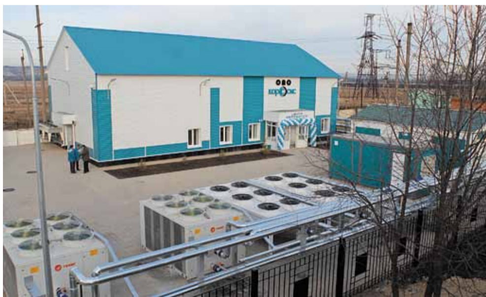
Центр обработки данных ОАО «КорСсис» в г. Валуйки

Виды аутсорсинга: ИТ-аутсорсинг, бухгалтерский, финансово-экономический, юридический, кадровый аутсорсинг, аутсорсинг менеджмента качества, уборка помещений (клининг), аутсорсинг эксплуатации объектов недвижимости, логистический или транспортный аутсорсинг.