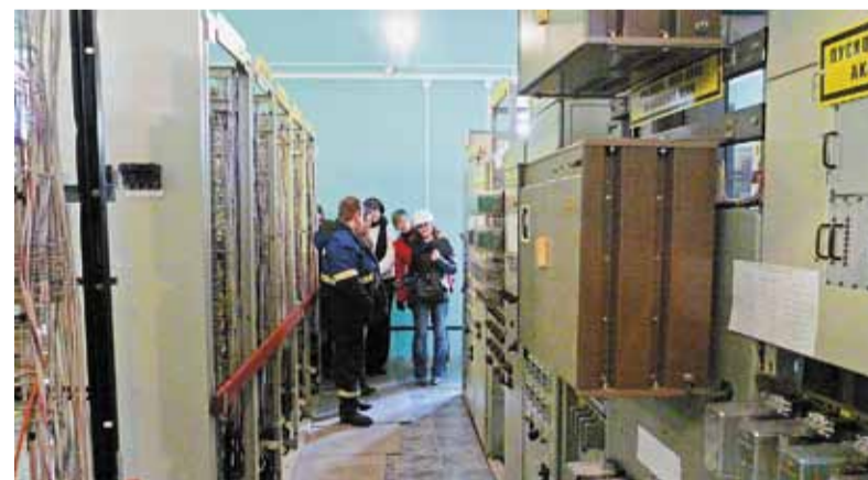
В рабочие будни посторонним сюда вход воспрещён!

станций, линий электропередачи, оперативно управлять распределительными сетями, в чём смогли убедиться присутствующие, наблюдая за работой диспетчеров.